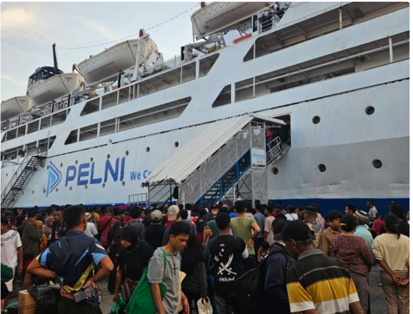
Bhayangkara - Humas Polres Maros

Makassar - Kejadian terbakarnya kapal, KM.Umsini dari Bau-Bau tujuan Surabaya, Saat transit di Pelabuhan Soekarno Hatta Makassar, membuat Polres Pelabuhan Makassar bergerak cepat melakukan evakuasi